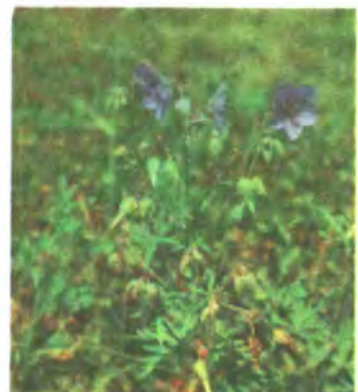
515. Герань лучна.